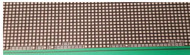
Module abimé dû à un choc : trop de LED tombées