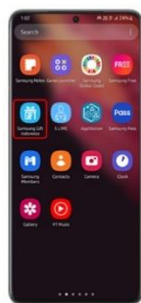
Step 1 Pilih aplikasi Samsung Gift Indonesia