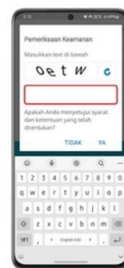
Step 4 Masukkan kode captcha