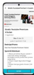
Step 3 Lanjut ke halaman konfirmasi & klik "Ambil" untuk mendapatkan kode voucher