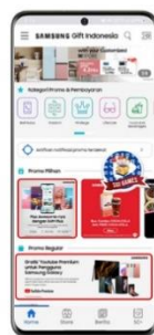
Step 2 Temukan Youtube Premium voucher di menu regular promo