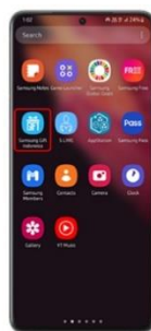
Step 1 Pilih aplikasi Samsung Gift Indonesia