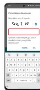
Step 4 Masukkan kode captcha