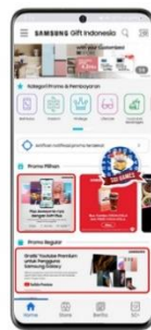
Step 2 Temukan Youtube Premium voucher di menu regular promo