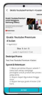
Step 3 Lanjut ke halaman konfirmasi & klik "Ambil" untuk mendapatkan kode voucher