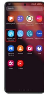
Step 1 Pilih aplikasi Samsung Gift Indonesia