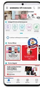
Step 2 Temukan Youtube Premium voucher di menu regular promo