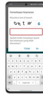
Step 4 Masukkan kode captca