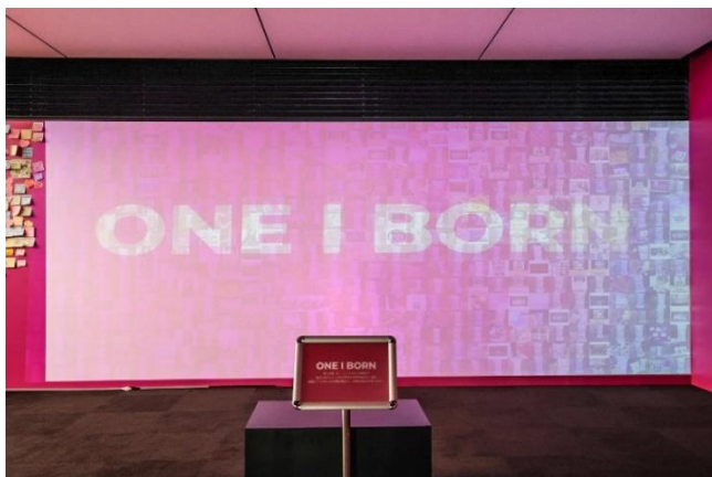
ONE | BORN Archive Wall