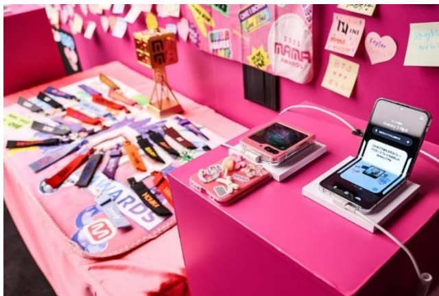
「Galaxy Z Flip5」、ストラップなど展示