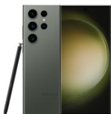
Galaxy S23 Ultra