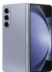
Galaxy Z Fold5