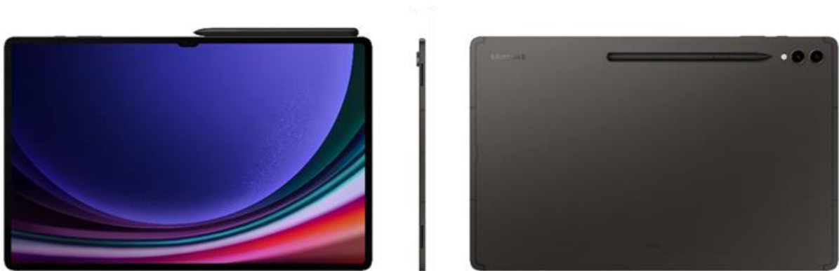
<Galaxy Tab S9 Ultra>

https://www.samsung.com/jp/tablets/galaxy-tab-s/galaxy-tab-s9-ultra-wi-fi-graphite-512gb-sm-x910nzaexjp/