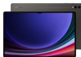
Galaxy Tab S9 Ultra