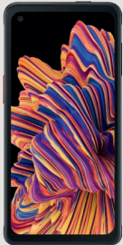
Galaxy XCover Pro

Les appareils particulièrement robustes sont à l'aise là où l'on travaille dans des conditions extrêmes. Résistants à l'eau, à la poussière et aux chocs, ce sont des compagnons fiables, robustes à l'extérieur, intelligents à l'intérieur.