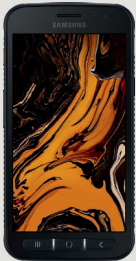
Galaxy XCover 4s