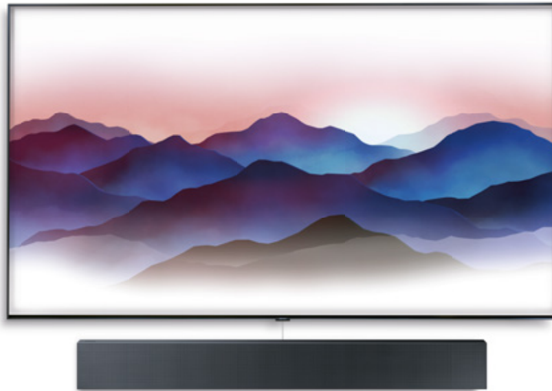
QLED TV 75Q9FN 1 (600 € Cashback) HW-NW700 (75 € Cashback)