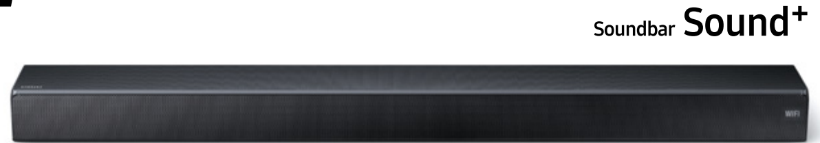
HW-MS750 (60 € Cashback)