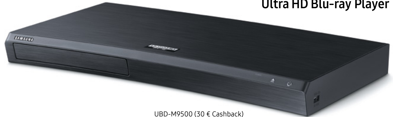
UBD-M9500 (30 € Cashback)