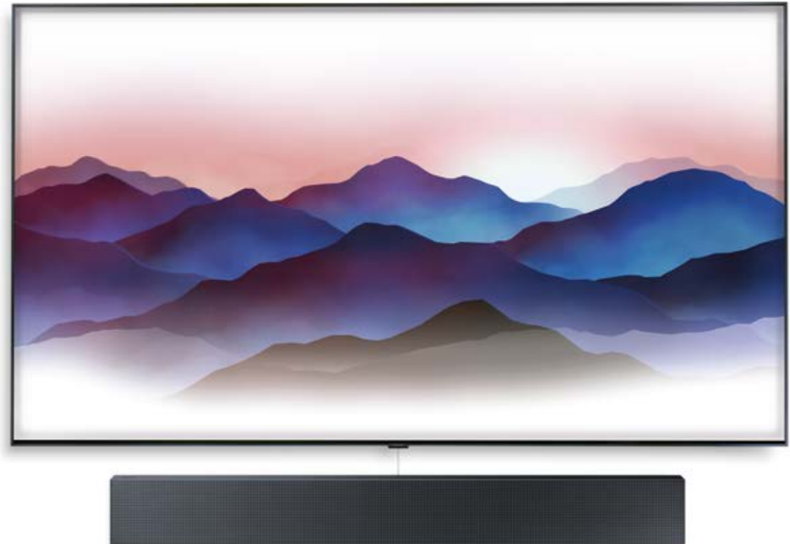
QLED TV 75Q9FN 2 (600 € Cashback) HW-NW700 (75 € Cashback)