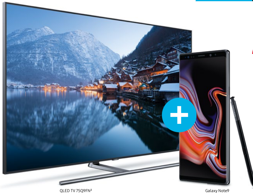
QLED TV 75Q9FN²