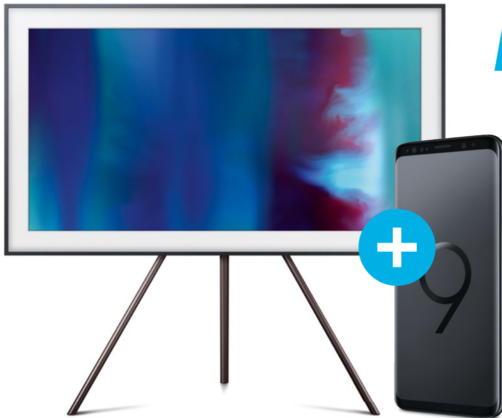
The Frame 65LS03N 2 , Staffelei-Standfuß als separates Zubehör erhältlich