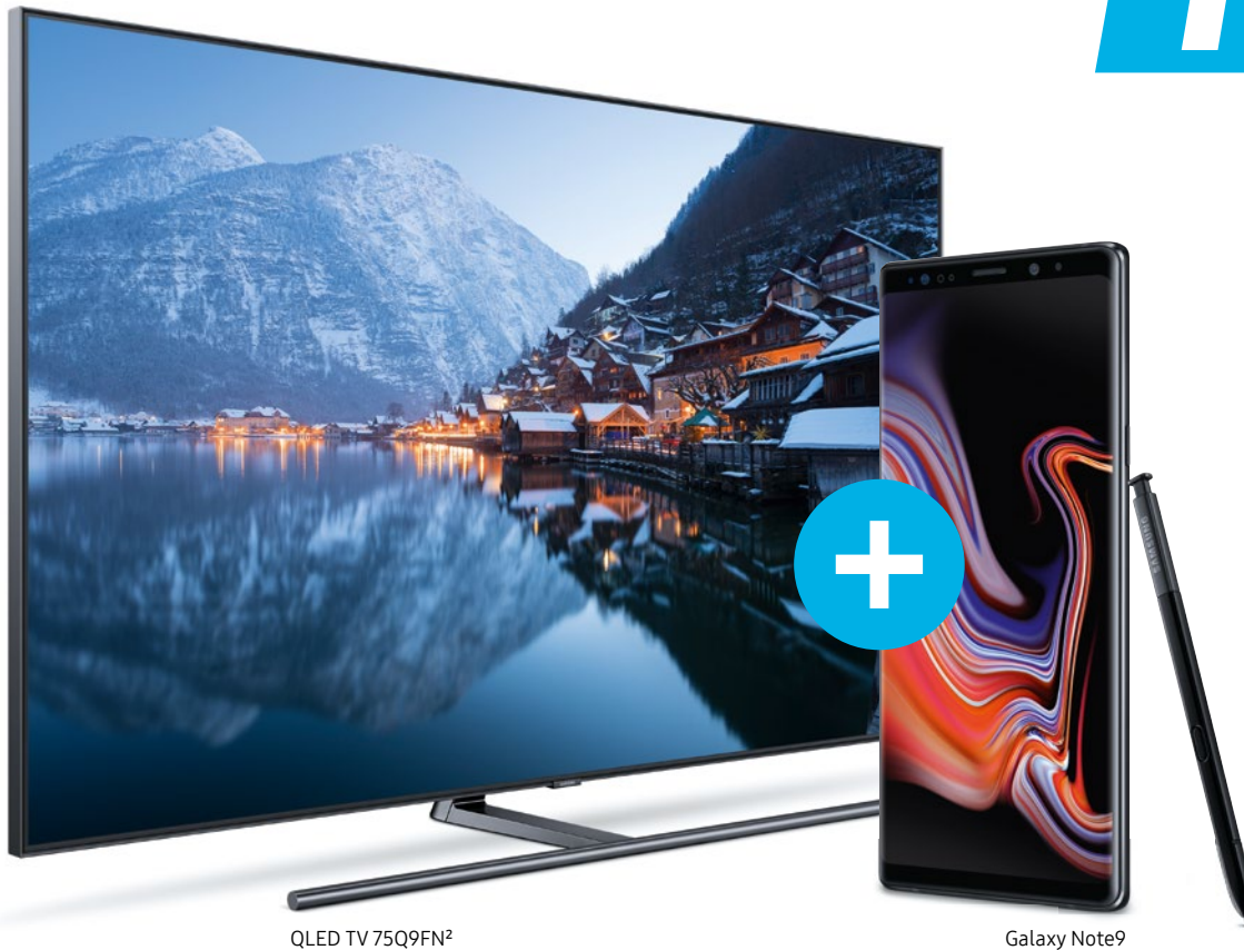
QLED TV 75Q9FN 2