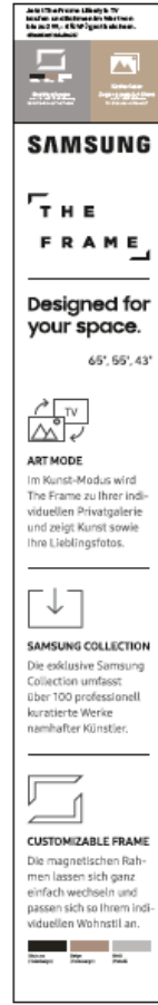
Stele, bereits am PoS vorhanden.

X-Banner 600x1.600 mm Das X-Banner wird in die mitgelieferte Halterung eingespannt und kann an den folgenden Stellen platziert werden: im Eingangsbereich oder direkt neben der Stele. Die Halterung nach Ende der Aktion bitte aufbewahren.