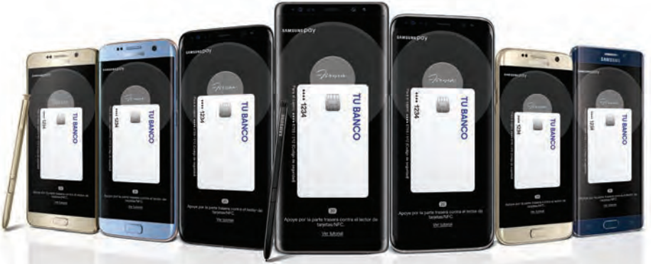
Galaxy Note5 | Galaxy S7 edge | Galaxy S8 | Galaxy Note8 | Galaxy S8+ | Galaxy S7 | Galaxy S6 edge+

Este sistema está disponible en los Smartphones Samsung Galaxy serie N, S, A y J.