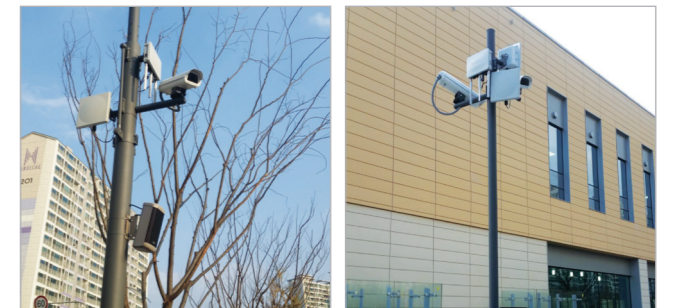
<설치 사례 - 대구 삼성크리에이티브캠퍼스>