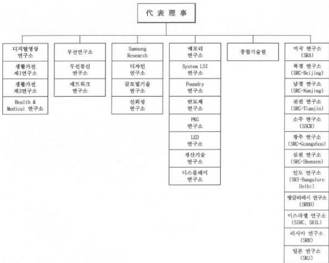
제52기 1분기 연구개발조직도