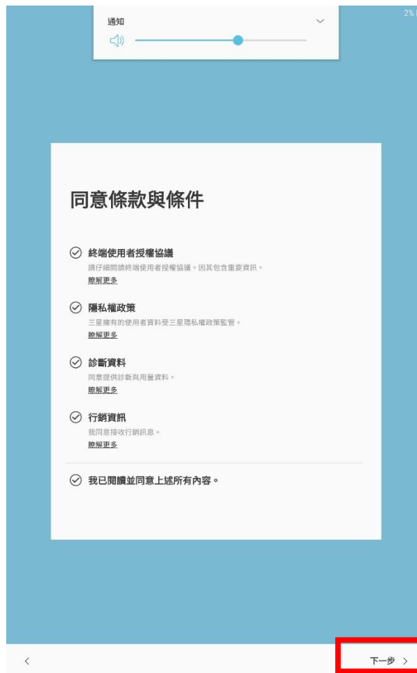
步驟3. 確認同意條款與條件