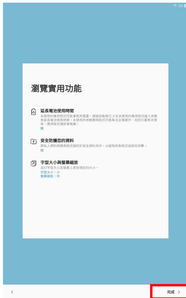
步驟10. 瀏覽實用功能並點選完成