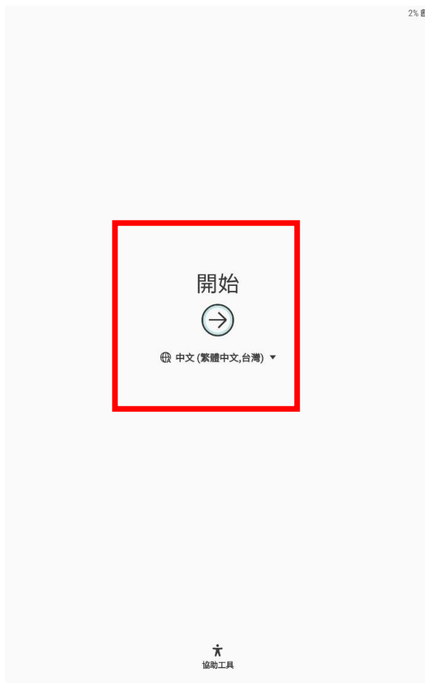
步驟1. 開啟平板電源