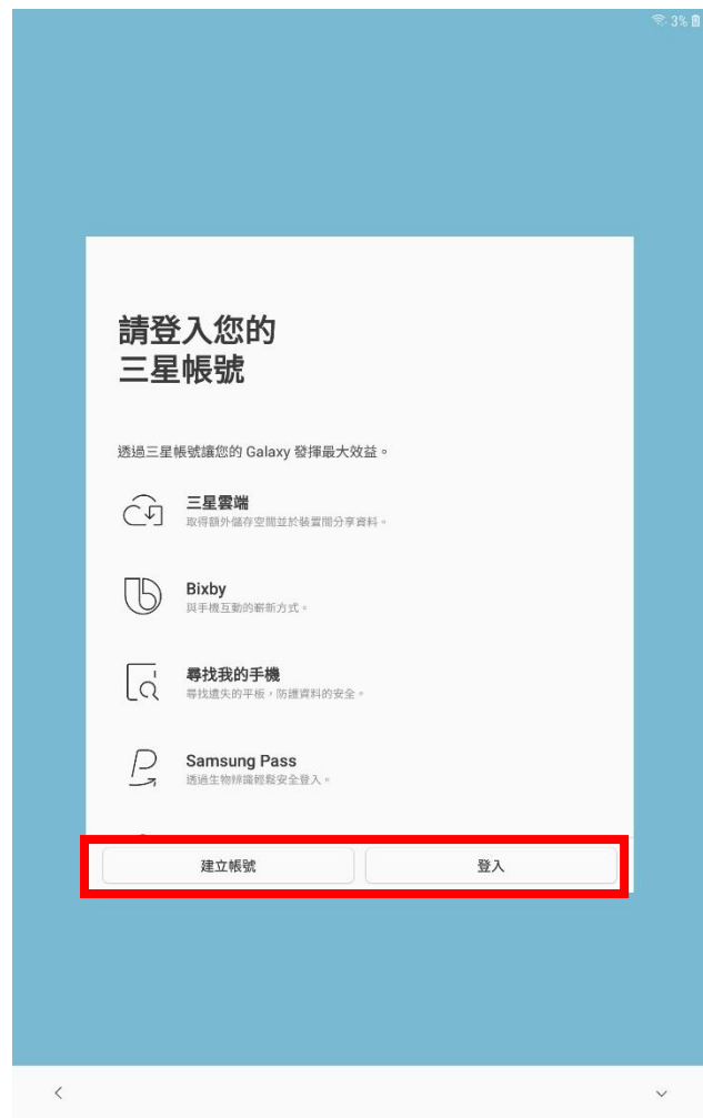
步驟9. 登錄/建立三星帳號